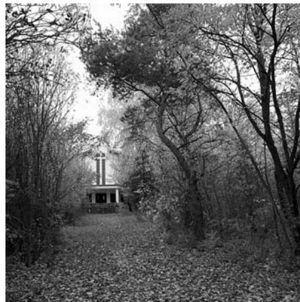
2. cena – Radka Strouhalová, 8.B