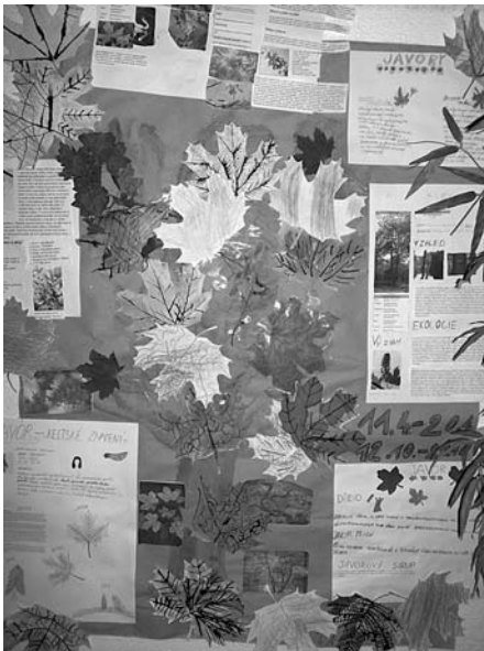
1. cena - Javor, 4.A