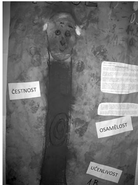
2. cena - Topol, 1.B