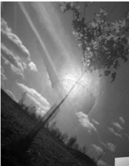
1. cena - Denisa Líznarová, 9.A

Starší žáci soutěžili jednotlivě. Mohli se zapojit do fotosoutěže na téma „Nejkrásnější stromy mého okolí“, popř. „Památné stromy v mém okolí“. Bylo vybráno 23 soutěžních fotografií. Vyhodnocení se zúčastnili někteří pedagogové, členové Ekotýmu a žáci volitelného předmětu environmentální výchova.