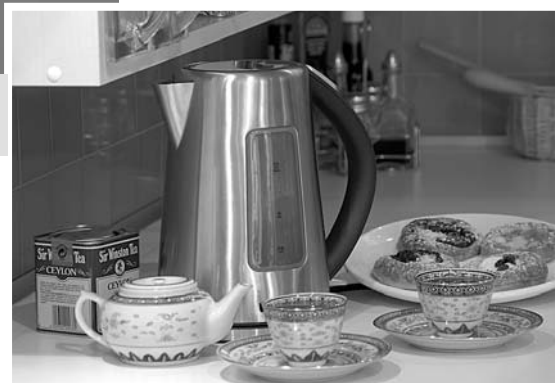
I moderní rychlovarná konvice může šetřit rozpočet domácnosti

Možná by stálo za to, sednout si a spočítat, kolik bychom v domácnosti ušetřili, kdybychom si koupili spotřebič nový, energeticky úsporný. I když jde jednorázově o nezanedbatelný výdaj, návratnost se kvůli rostoucím cenám energií výrazně zrychluje.