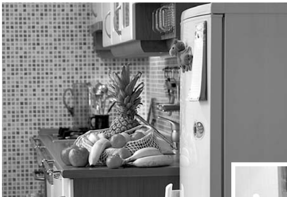
Lednice označená třídou A+ šetří nejen peníze, ale i životní prostředí

Je známo, že dnešní průměrná pračka spotřebovává o 44 % méně elektrické energie a o 62 % méně vody než průměr-