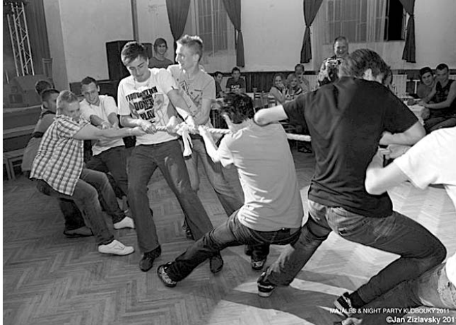
Majáles 2011 - silová disciplína