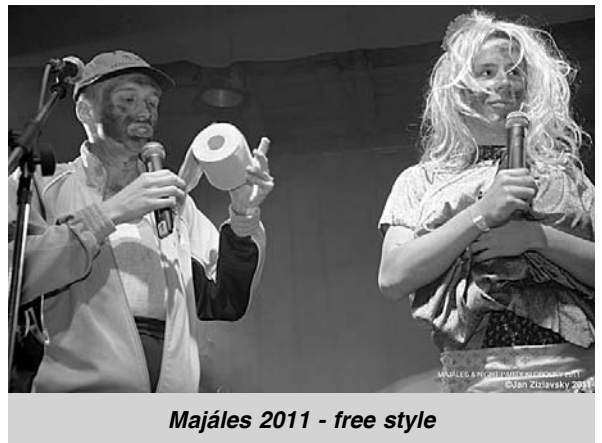
Majáles 2011 - free style