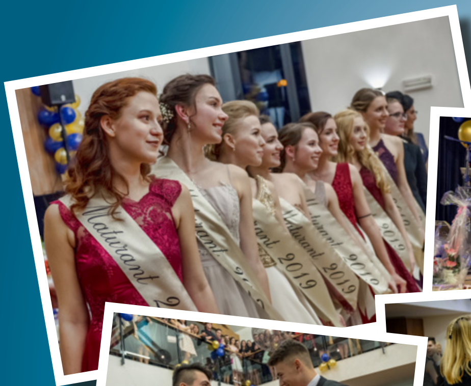
▼ 20. Reprezenční ples MěVG