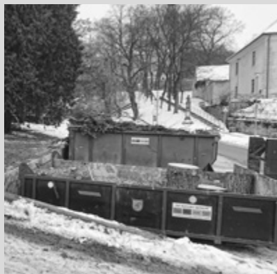
vykácený smrk na náměstí